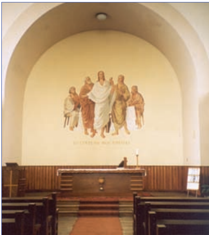
Interier sboru se vzkříšeným Kristem (Čáslav)