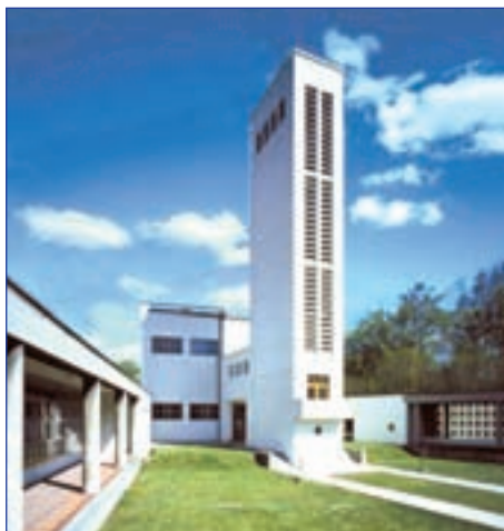
Komplex budov náboženské obce a diecézní rady v Hradci Králové, 1929 (projekt architekta Gočára)