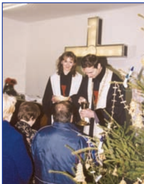
Společná večeře Páně (přijímání)