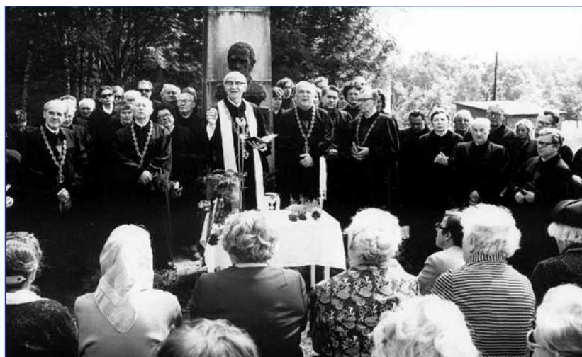
Pravidelné červenové celocírkevní shromáždění ve Škodějově – rodišti patriarchy Karla Farského