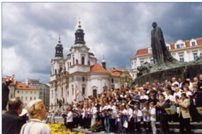
Vystoupení pěveckých sborů na Staroměstském náměstí v Praze