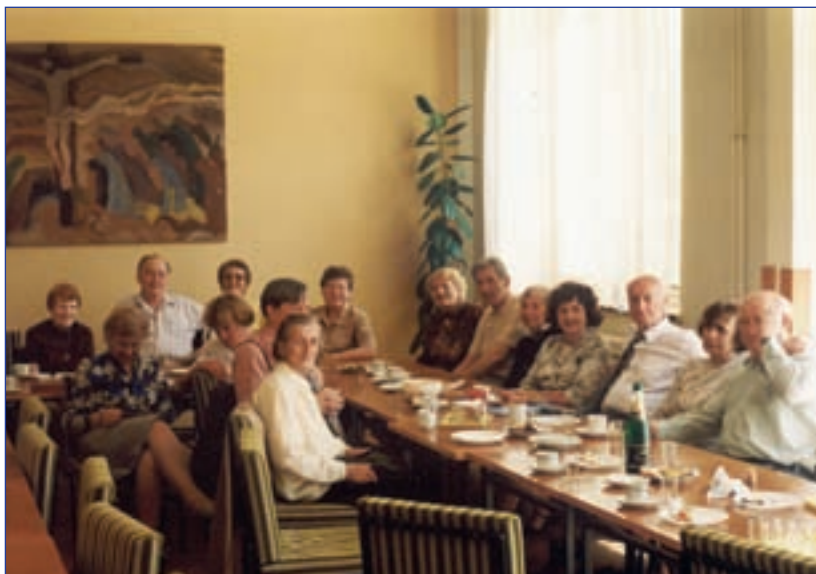
Setkání členů Akademického klubu Tábor