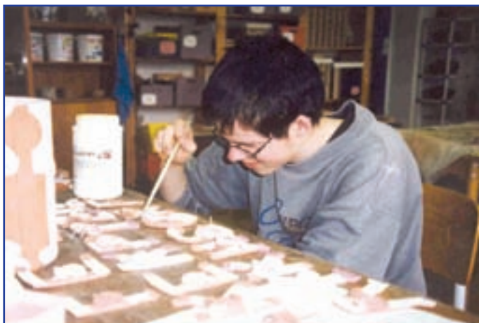
Lomnická společnost dětí zdravotně postižených (Rváčov)