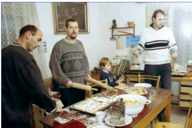
„Štrůdlování“ v Domečku – integrovaném středisku Nazaret (Trhové Sviny)