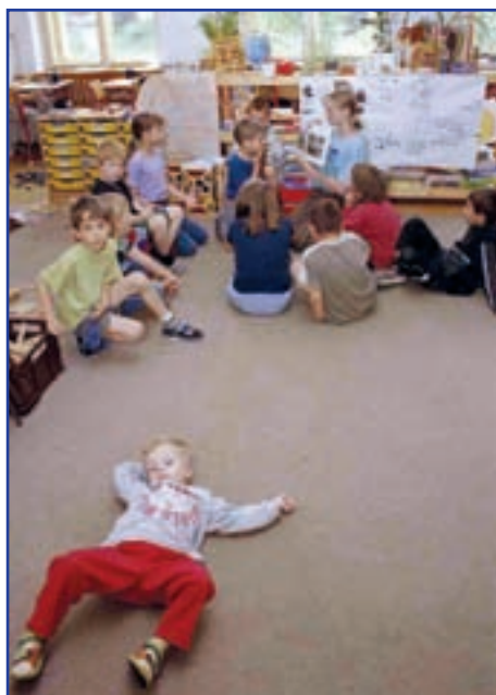
Církevní mateřská škola