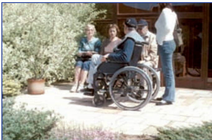
Středisko křesťanské pomoci Betanie