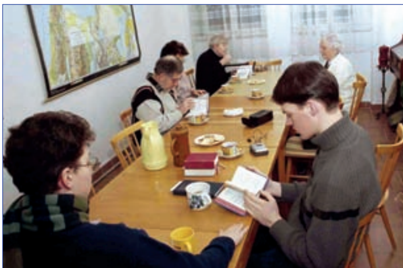
Společné večery nad Biblií