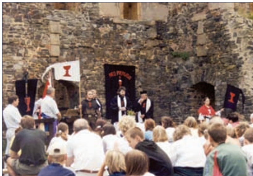
Husovské oslavy na Kozím Hrádku