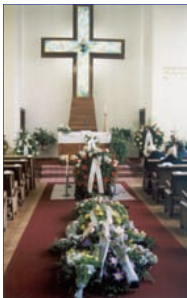
Rozloučení se zesnulým (sbor)

plně a tvaru, společných úvah nad Bibli („biblické hodiny“), křesťanské výuky a výchovy dětí a mládeže, katechetického vzdělávání čekatelů na křest nebo snoubenců před oddavkami, může se účastnit přednášek a besed, případně koncertů duchovní hudby atd. Přístupná všem je i sborová knihovna.