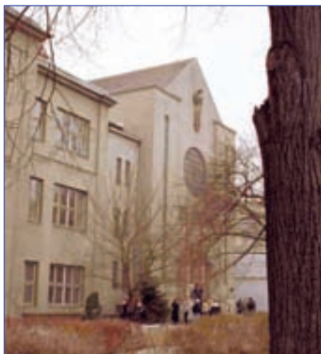
Bývalá synagoga (Prostějov)