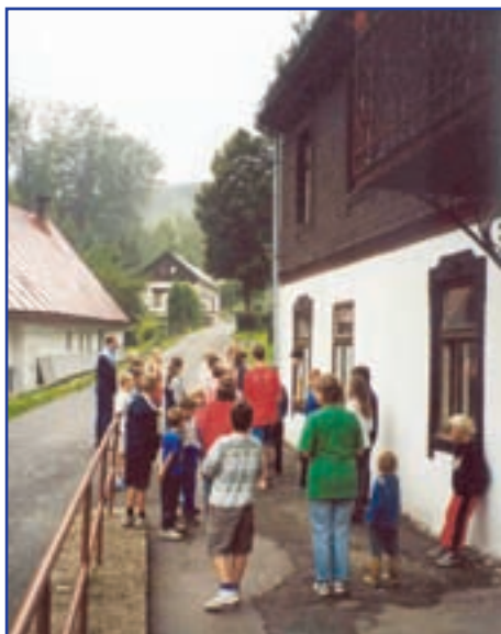
Před rekreačním střediskem Betlém (Janské Lázně)