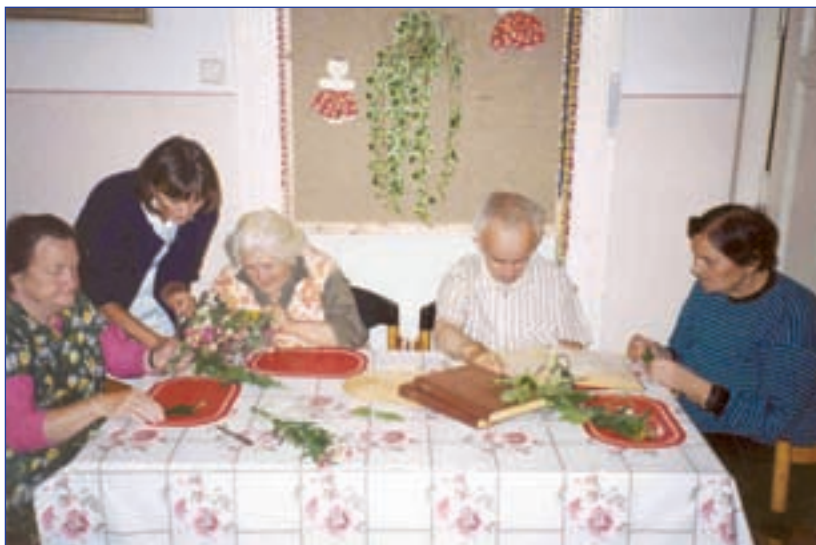
Penzion pro ubytování seniorů Horizont (Praha)