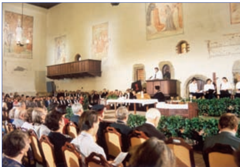
Slavnostní bohoslužba na památku mučednické smrti Mistra Jana Husa konaná každoročně za účasti televize a státních hostů v Betlémské kapli