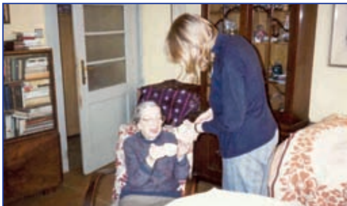
Domácí péče o seniory

BETLÉM – rekreační zařízení královéhradecké diecéze, 542 25 Janské Lázně, Dolní promenáda 7. Tel 499 875 209; 499 875 069, http://www.betlem.ccshhk.cz , betlem@ccshhk.cz