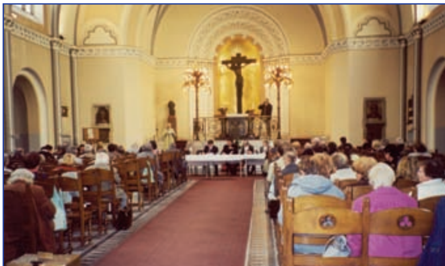
Zasedání církevního sněmu (parlamentu všech náboženských obcí, duchovenstva a úřadů CČSH)

a všichni členové ústřední rady. V jeho pravomoci je vydávat celocírkevní předpisy (statuty, jednací řády), zabývat se hospodařením církve a jejími neodkladnými problémy. Církevní zastupitelstvo rovněž volí Právní radu, rozhodující o návrzích na zrušení rozhodnutí církevního orgánu pro jeho eventuální rozpor s církevními předpisy.