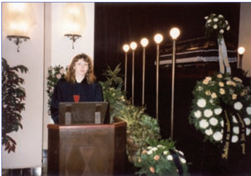
Rozloučení se zesnulým (krematorium)