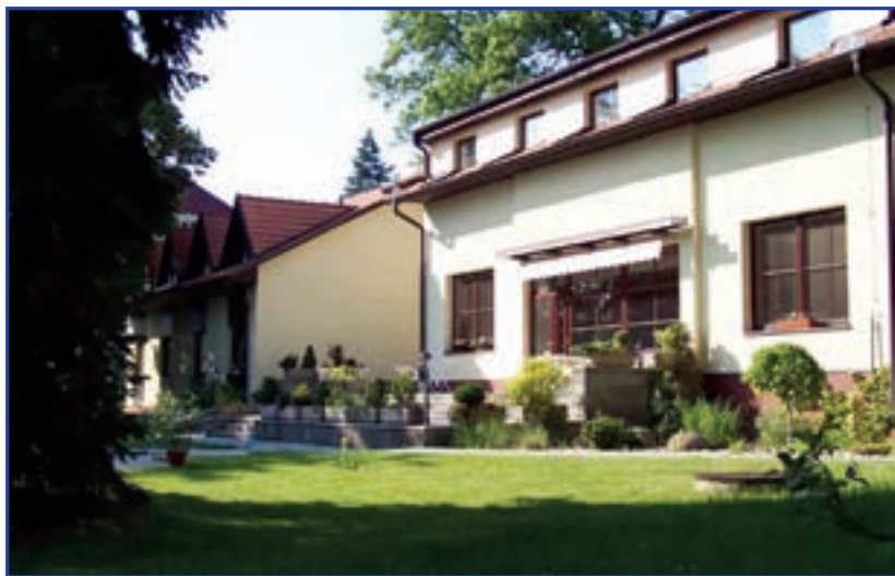
Školící a rekreační středisko Brno-Lipová