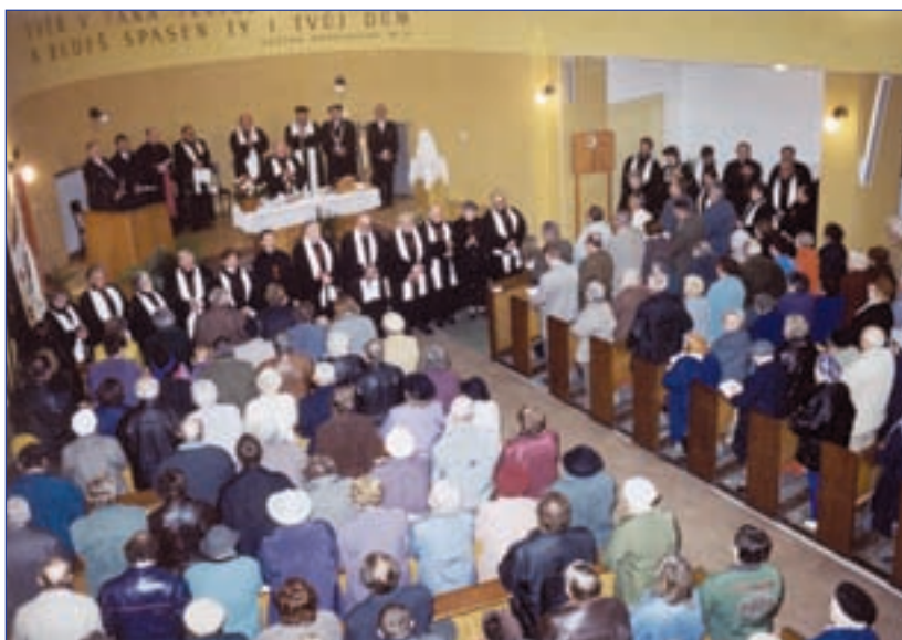
Slavnostní bohoslužebné shromáždění