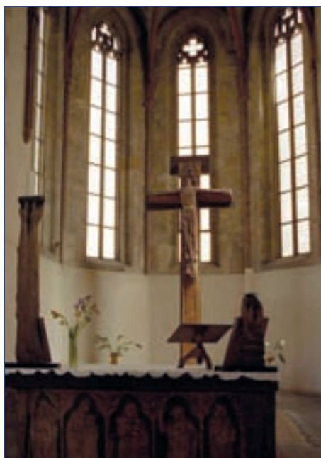
Bohoslužebný stůl (Náboženská obec Na Zderaze)