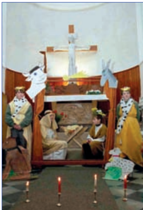
Duchovní péče o děti