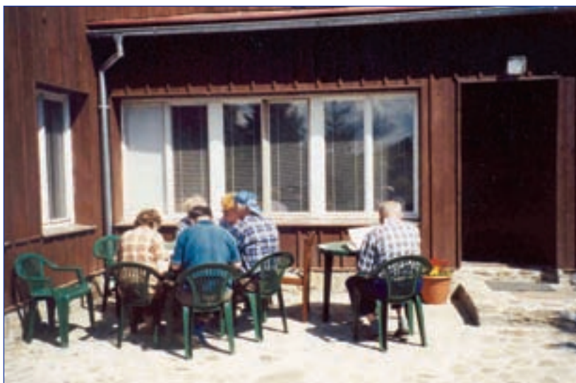
Na verandě rekreačního zařízení Husita (Železná Ruda)