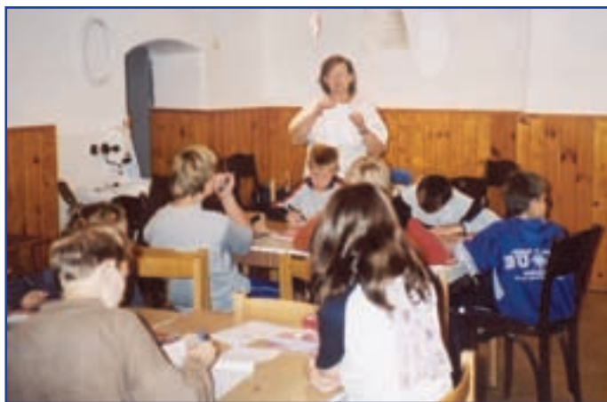
Duchovní péče o mládež