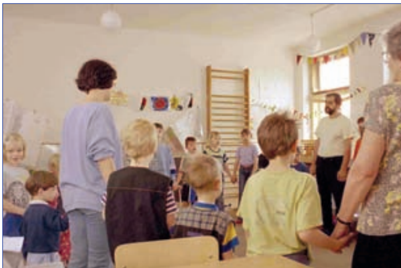
Církevní základní škola a mateřská škola ARCHA (Petrupim, Benešov)