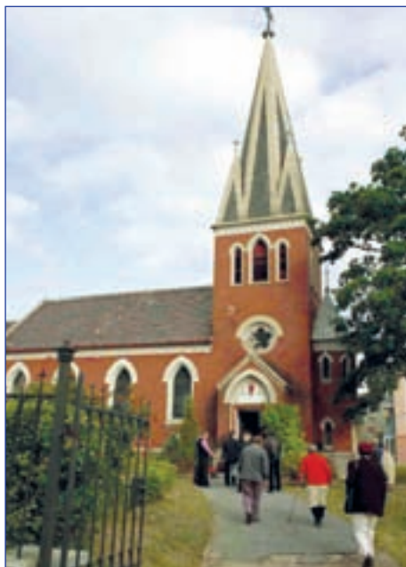
Jeden z kostelů po německých evangelících v pohraničí (Kadaň)