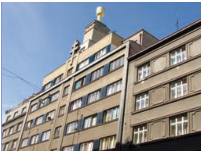
Budova sboru v občanské zástavbě (Praha 7-Holešovice)