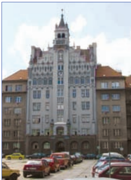
Ústřední budova Církve československé husitské (s bohosloveckou kolejí a s knihovnictvím Blahoslav) – Praha 6-Dejvice, Wuchterlova 5

Členy ústřední rady jsou vedle patriarchy biskupové a zvolení laičtí zástupci všech diecézí. Úřad ústřední rady sídlí v „ústřední budově“ v Praze 6-Dejvicích, Wuchterlova 5.