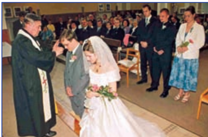
Oddavky do svátosti manželství