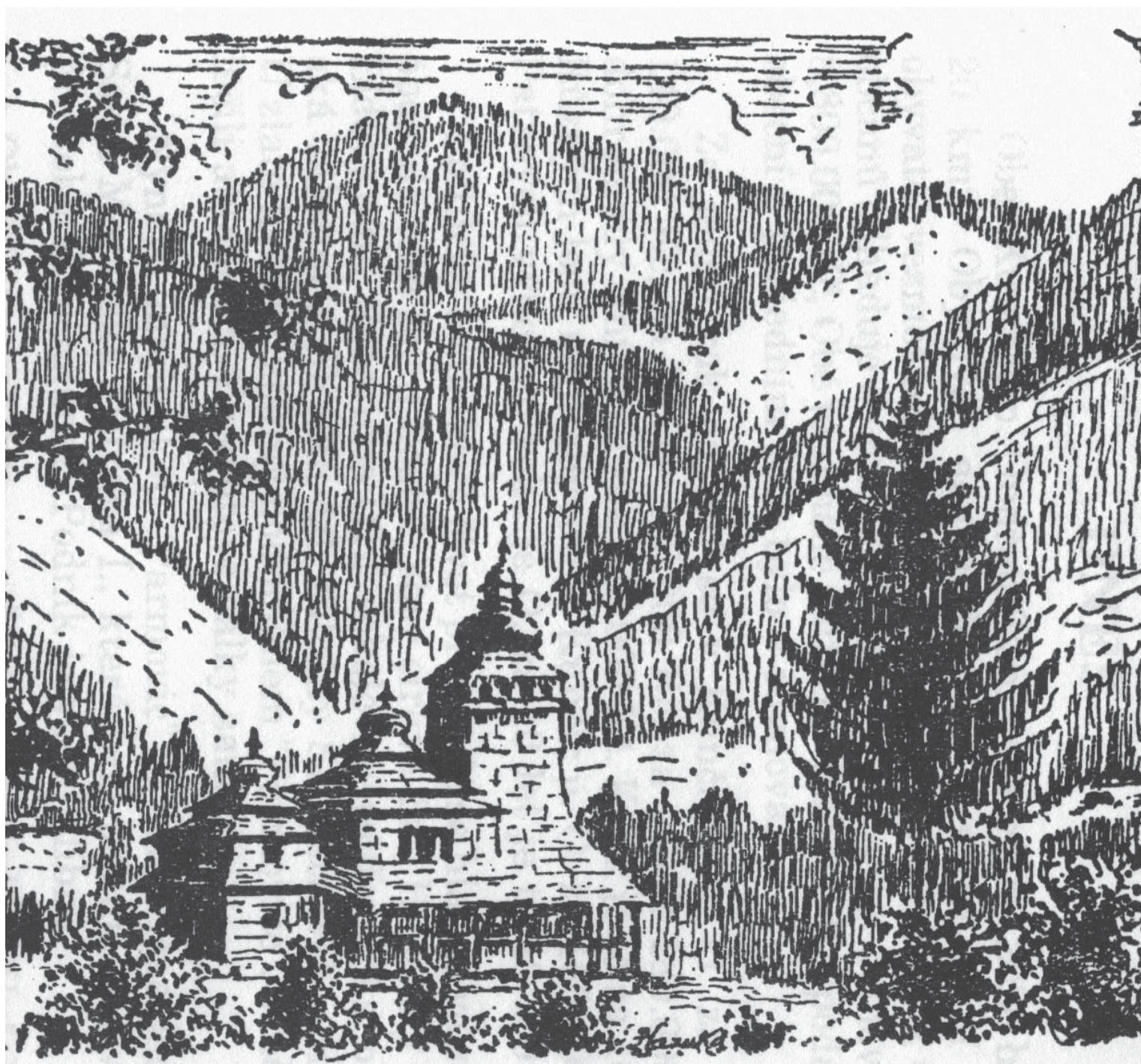
Dřevěný kostelík v Kunčicích pod Ondřejníkem

Sborový časopis Náboženské obce Církve československé husitské v Praze Vršovicích