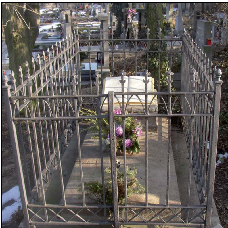
Amerlingův hrob na Budči

církve, člověčenstva“. Moderní člověk má podle Amerlinga srústat s Bohem a přírodou, což zní dosti cize nám, kteří jsme odchováni biblickým svědectvím o propasti mezi Bohem a člověkem a o tom, že tato propast může být překlenuta jedině z Boží strany, v Kristu. Tuto naši závislost na Boží shovívavosti vyjadřuje Amerling pouze náznakem: „Velký je sice obor povinností, velký ale i svou milostí Bůh.“ To však nic nemění na našem obdivu k šíři Amerlingových zájmů a jeho neutuchající činnosti, píli a obětavosti.